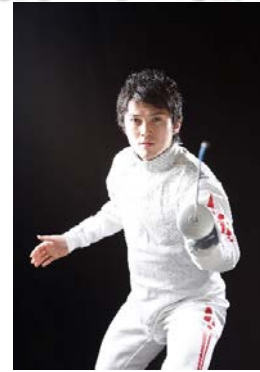
2008年北京オリンピック日本代表 2012年ロンドンオリンピックフェンシング 男子フルール団体銀メダルを獲得

※第1部・第2部とも体験教室の内容は同じです。ご希望の会場を選択してください。 ※当日の見学のみも可能です。募集締切後の参加希望者は、担当者までご連絡ください。